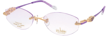
C-2 GP×VIO ホワイトトパーズ/アメジスト