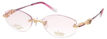
C-1 GP×RD ホワイトトパーズ/ガーネット