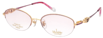
C-1 GP×RD ホワイトトパーズ/ガーネット