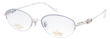
C-3 WP×BL×W アイオライト/ホワイトトパーズ