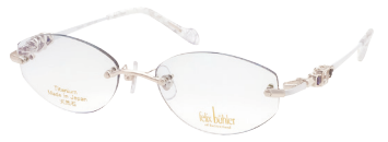
C-3 WP×BL×W アイオライト/ホワイトトパーズ