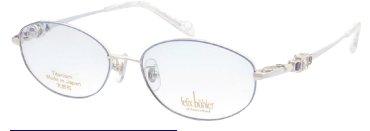
C-3 WP×BL×W アイオライト/ホワイトトパーズ