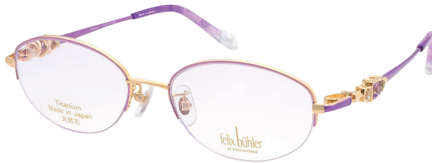
C-2 GP×VIO ホワイトトパーズ/アメジスト