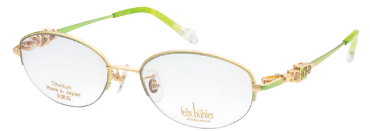
C-4 GP×GN ホワイトトパーズ/ペリドット