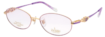
C-2 GP×VIO ホワイトトパーズ/アメジスト