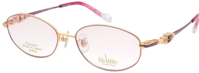
C-1 GP×RD ホワイトトパーズ/ガーネット