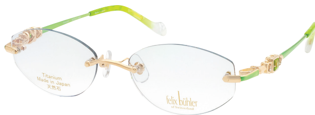
C-4 GP×GN ホワイトトパーズ/ペリドット